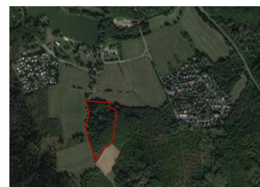
Übersichtsplan ohne Maßstab